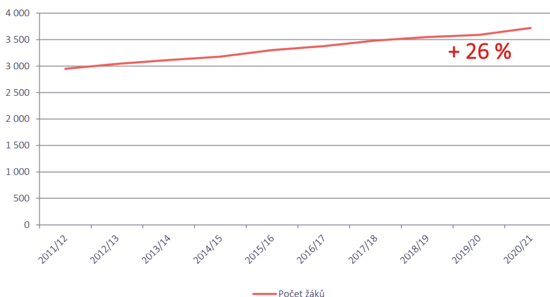
Graf č. 19 Vývoj počtu žáků ZŠ SO Praha 14

Od roku 2011 se počet žáků ZŠ ve spádovém území každoročně zvyšoval. Do roku 2020 narostl o 771 dětí, tj. o 26 %.